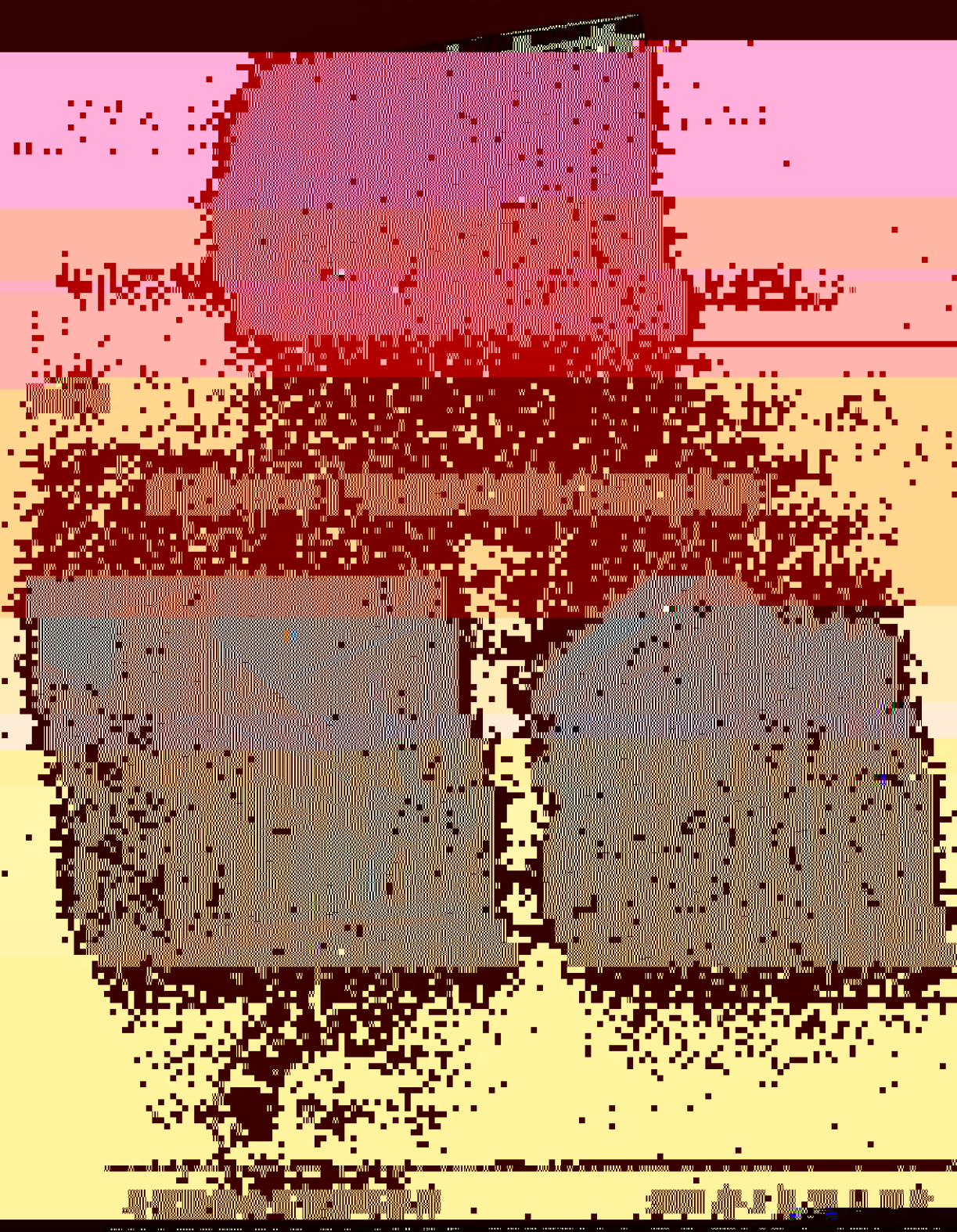
原4#5#干熄焦除尘器的现场图